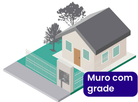
Muro com grade