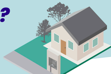
Apenas o abrigo

O abrigo para a instalação poderá ser construído das seguintes maneiras.