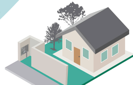
Muro com recuo